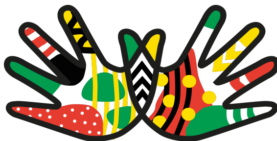
Illustration créée par Sarah Krebs, jan. 2022

Tiré de La Sexualité de l'enfant expliquée aux parents . Par Saint-Pierre Frédérique., Viau Marie-France, 2006, p.171-174.